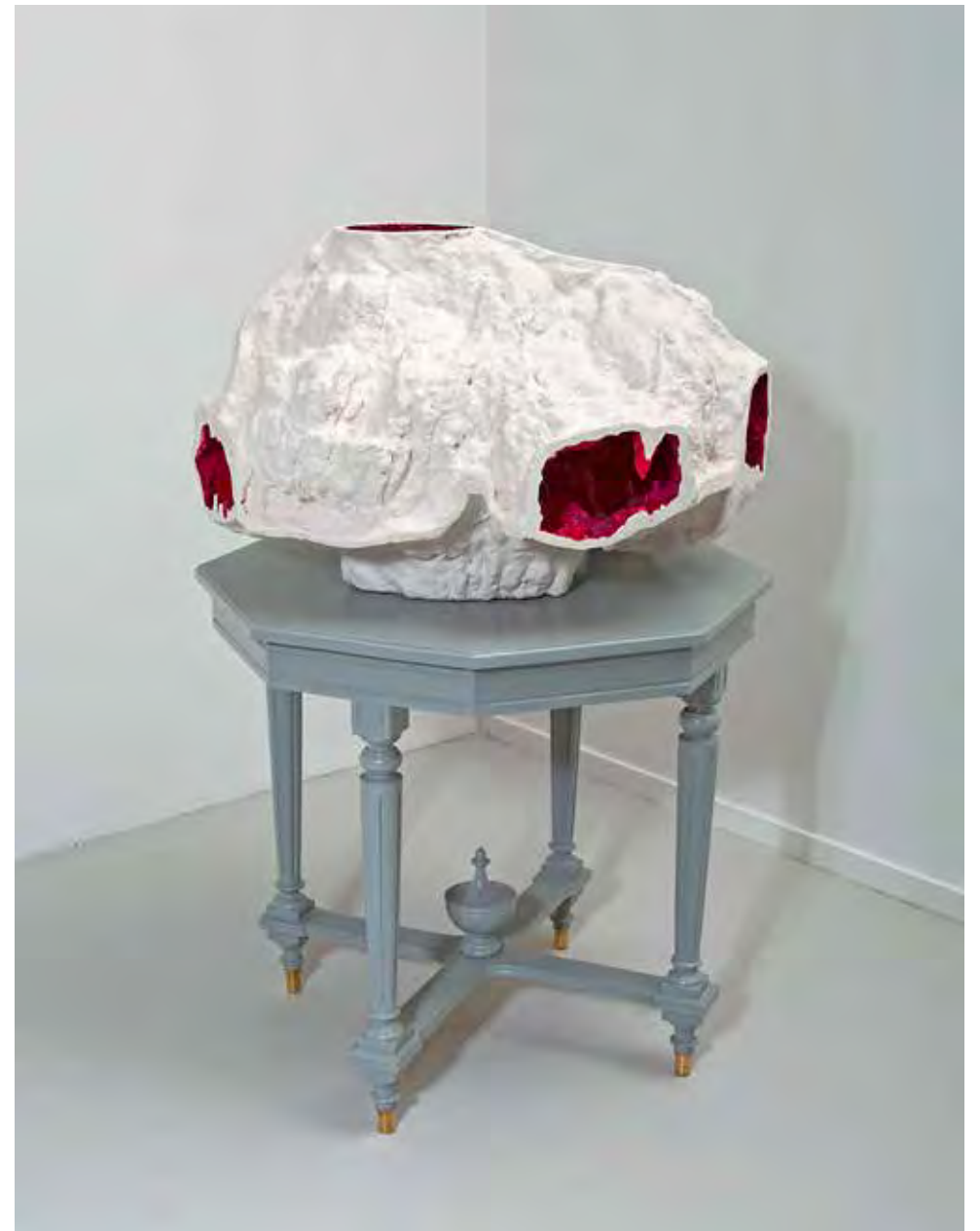
< The Red Cave (detail inside) 2020 - vinylfärg på duk - 58 x 44 cm