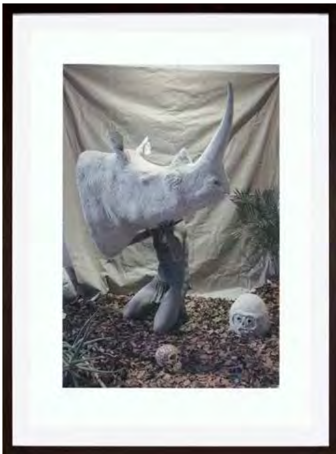
The Hunter 2016 - fotografi