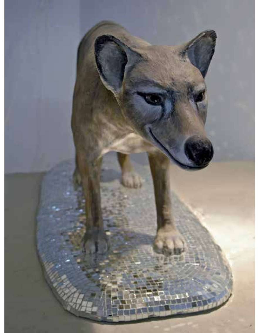
The Smile of the Tasmanian Tiger 2019-2020 - papier-maché, spegelmosaik, vinylfärg - 52 x 40 x 145 cm