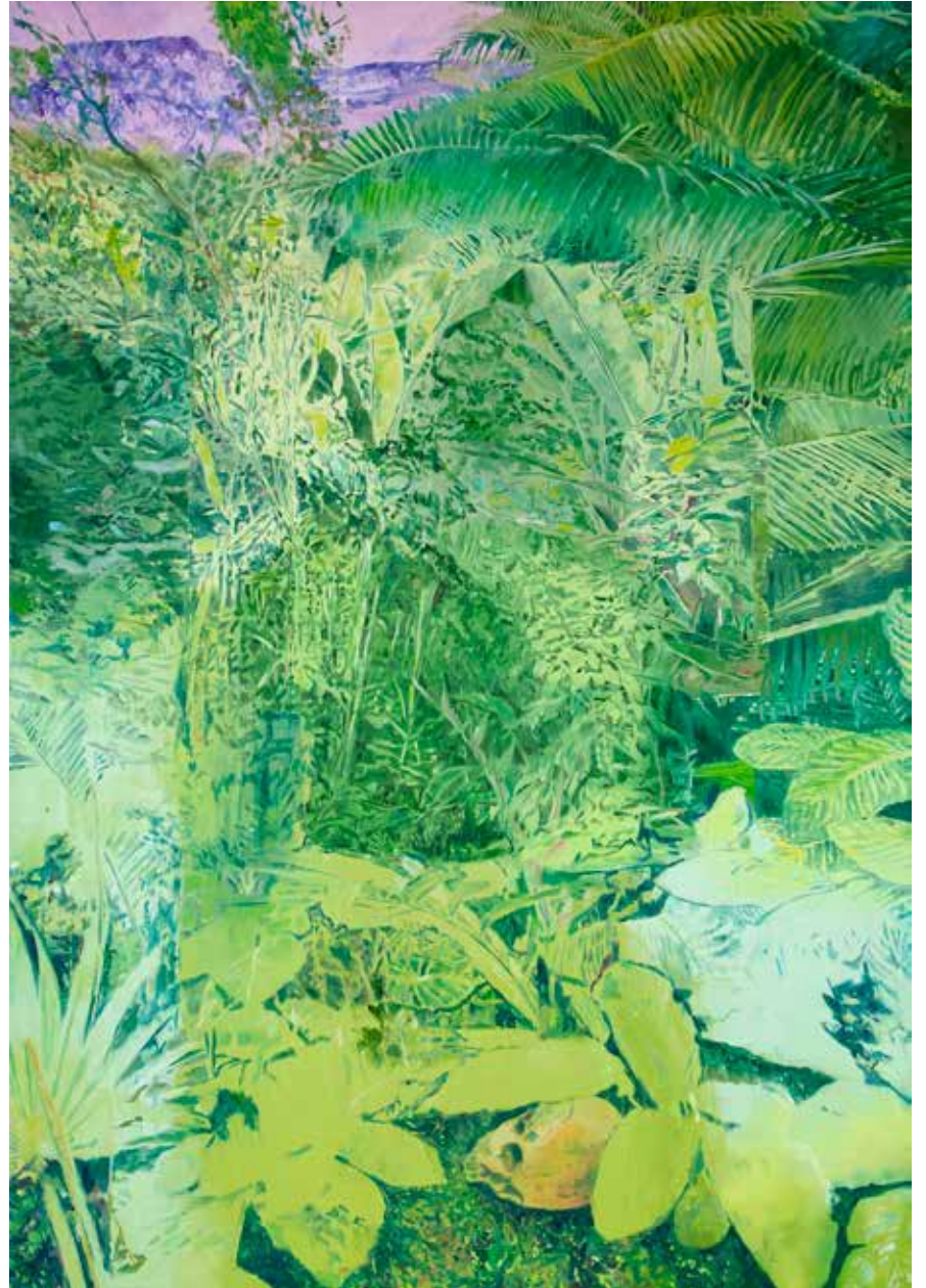
Deutscher Dschungel 2015 - olja på duk - 160 x 112 cm