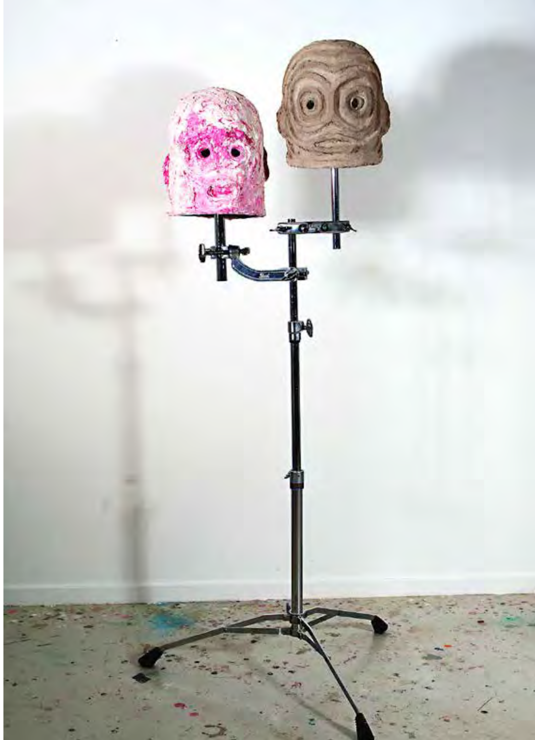
Two-Headed Boy > 2020 - papiermaché, oljefärg, stativ - ca 170 x 60 x 40 cm