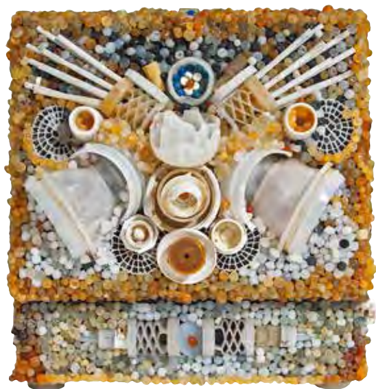
Souvenir de Gotembourg 2019 - plast på cigarrask - 8 x 11 x 21 cm