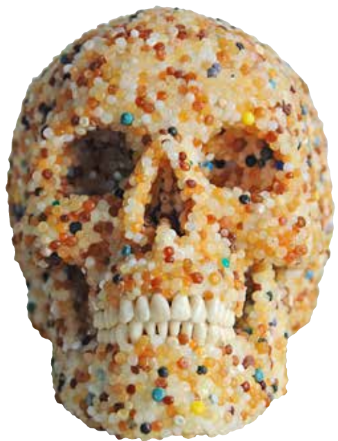
For the Love of boG

2012 - plastpellets på anatomisk plastkranie - 16 x 15 x 21 cm. Pelletsen hittats på stränder på Sardinien, Cornwall och Svenska västkusten