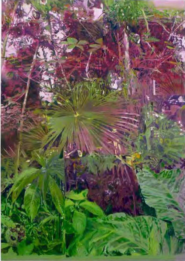
< Berlin Jungle 2015 - olja på duk - 162 x 112 cm