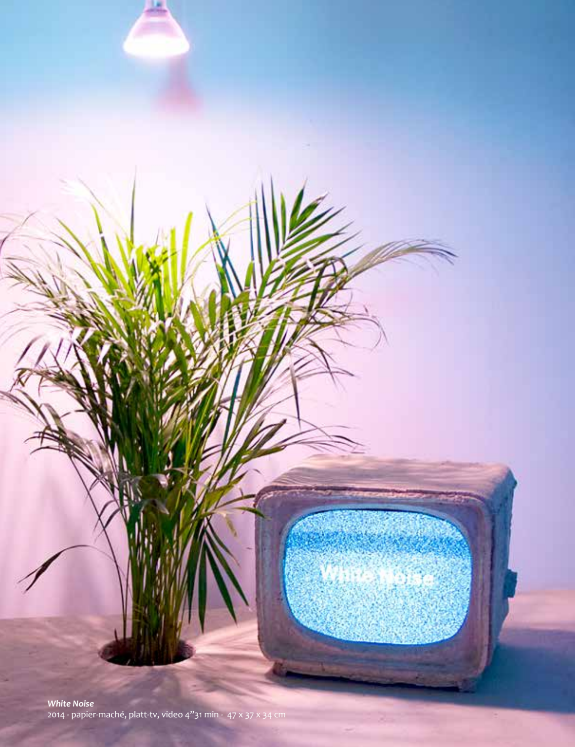
White Noise 2014 - papier-maché, platt-tv, video 4"31 min - 47 x 37 x 34 cm